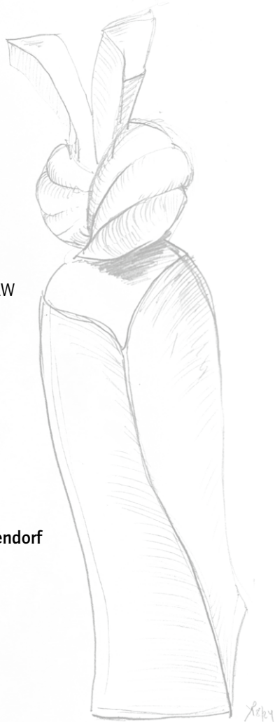
Die Preisskulptur, gestaltet von Katja Pelweckj